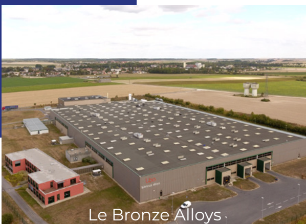
Le Bronze Alloys

“ Ce projet s'inscrit dans une démarche d'attractivité du territoire ”