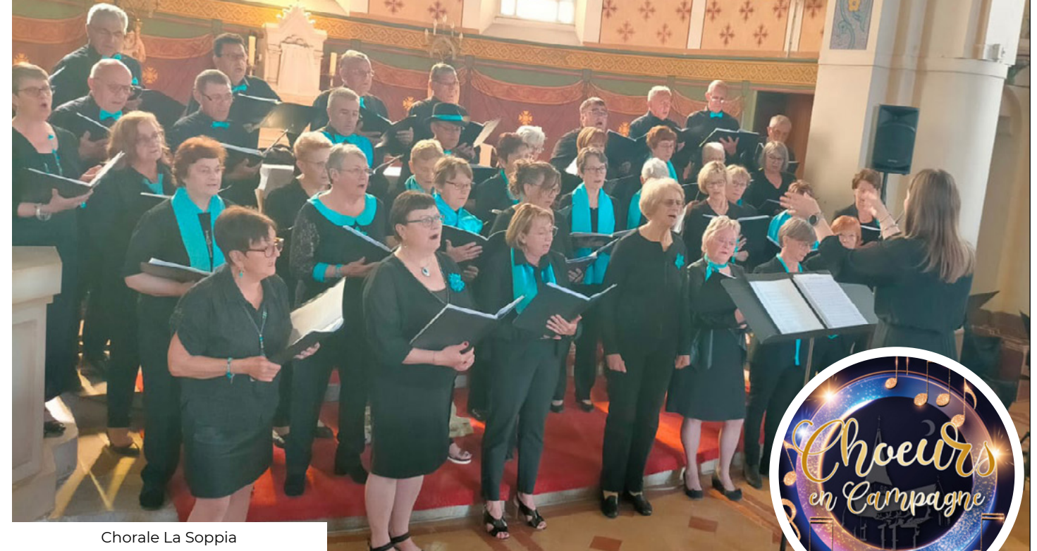
Chorale La Soppia

Les agences de l'eau sont des établissements publics de l'État et sont présentes dans chaque bassin hydrographique. Sur notre territoire, c'est l'agence de l'eau Seine-Normandie qui gère et préserve les ressources en eau. Les redevances perçues par l'agence de l'eau sur votre facture sont redistribuées, entre autres, aux collectivités, industriels, agriculteurs afin de financer des projets liés à l'eau et l'assainissement, notamment les projets qui visent à réduire les pollutions et donc à améliorer la qualité de l'eau.