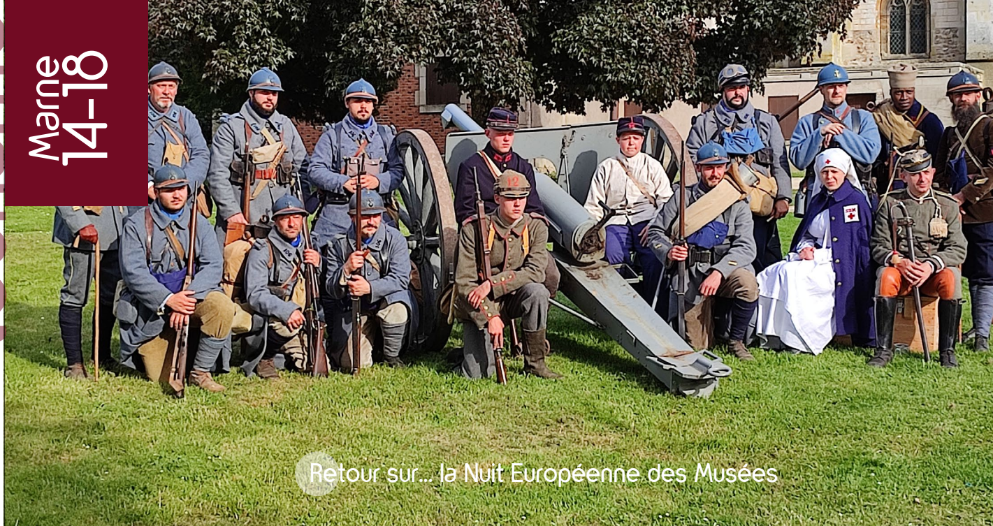
Retour sur... la Nuit Européenne des Musées

Le 14 mai 2022, à l'occasion de cette manifestation, le Centre d'Interprétation a accueilli l'association « Le poilu de la Marne ». Postés à l'extérieur du Centre, les membres de l'association vêtus d'uniformes ont animé un campement 14-18 et offert aux visiteurs la soupe du poilu, cuisinée dans une roulante. Au cours de la soirée, le canon de 75 a tonné deux fois pour le plus grand bonheur d'un public venu nombreux. En effet, plus de 250 personnes ont pu profiter des animations.