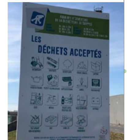
PANNEAU D'ENTRÉE DE LA DÉCHÈTERIE DE SUIPPES