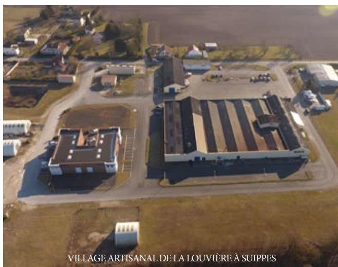
VILLAGE ARTISANAL DE LA LOUVIÈRE À SUIPPES

En application des mesures gouvernementales, chaque entreprise locataire des zones d'activités communautaires de la Louvière (Suippes) et de la Cressonnière (Somme-Suippe) s'est vue proposer un report de loyers, qui n'a été que très peu sollicité.