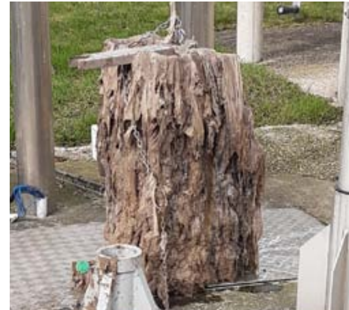
ETAT D'UN PANIER DÉGRILLEUR REMPLI CHAQUE SEMAINE PAR DES LINGETTES

Produits d'utilisation courante, les lingettes jetées dans les toilettes sont un fléau qui coûte cher à la collectivité et à l'environnement.