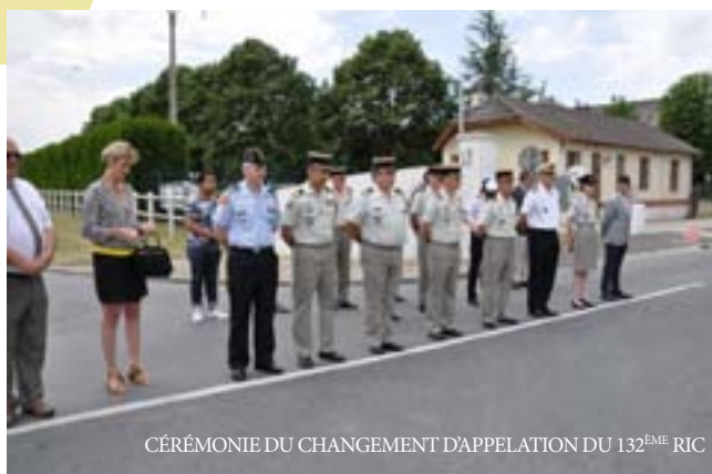
CÉRÉMONIE DU CHANGEMENT D'APPELLATION DU 132 ème RIC