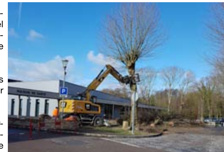
DÉBUT DES TRAVAUX À LA MAISON DE SANTÉ

Tout au long du chantier, une attention toute particulière sera portée à maintenir l'activité des praticiens, limiter les désagréments et conserver le nombre actuel de places de stationnement.