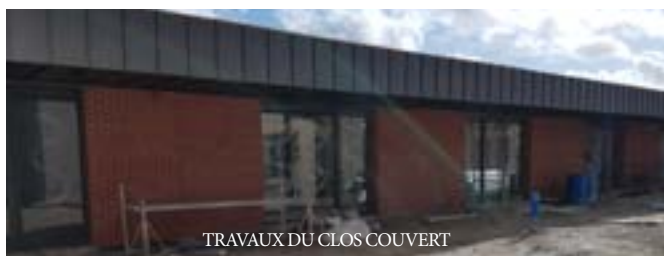
TRAVAUX DU CLOS COUVERT

Le clos couvert est terminé, comme le cloisonnement, alors que le plancher chauffant est en cours de réalisation. Les travaux de finition vont commencer très prochainement pour une fin de travaux prévu fin mars/début avril.