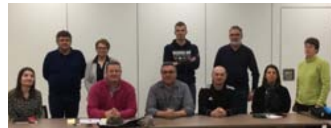
LE COMITÉ D'ORGANISATION LE 21 JANVIER DERNIER

Si vous voulez toucher les toits de l'Olympe et participer aux épreuves, ou alors participer à cet événement en tant que bénévole, n'hésitez pas à contacter la piscine de Suippes pour connaître les modalités d'inscription.