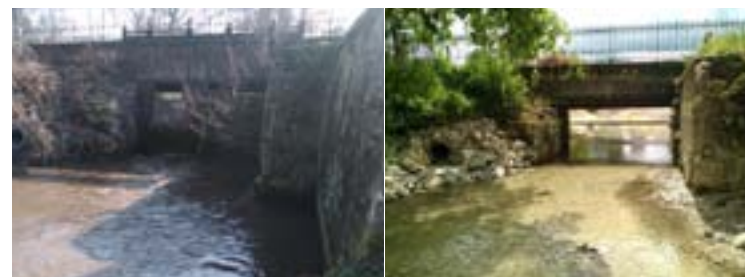
VANNAGE DE SUIPPES VUE DE L'AVANT TRAVAUX

L'ancien bras de dérivation de La Suipe, transformé en noue, a aujourd'hui vocation à infiltrer les eaux pluviales urbaines.