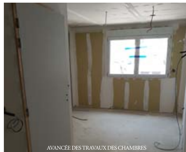
AVANCÉE DES TRAVAUX DES CHAMBRES

clos couvert. Les dernières menuiseries viennent d'être posées. Le cloisonnement est en cours de réalisation. L'objectif est un livraison du bâtiment fin mai.